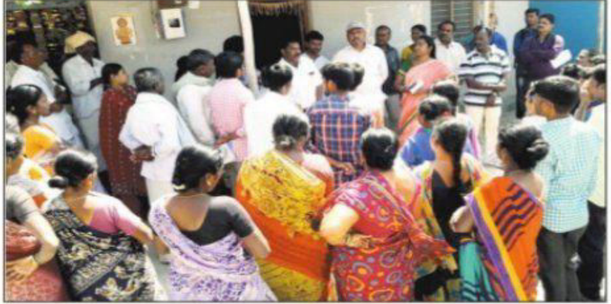
నగదు లావాదేవీలపై అవగాహన కల్పిస్తున్న అధికారులు